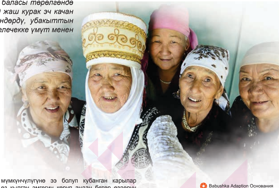
Babushka Adaption Основания

Баары эле физикалык жана руханий жактан жакшы карып, келечекте эч кимден көз каранды болбой улгайгысы келет. 65 жаштан жогору кары деп саналып, 85 жаштан өткөн адамдардын саны барган сайын артып жаткандыгын эске алганда кутмандуу карылыктын мааниси көтөрүлөт. Фонд тарабынан сапаттуу жана ден соолуктуу карылыкты максат кылган бир катар тренинг, семинарлар уюштурулуп турат. Пенсионер жашына келип, бирок үйдө жөн отургусу келбеген улгайган адамдарды бала багуучу, окутуучу, кол өнөрчүлүк сыяктуу кесиптерге үйрөтүп багыт берүүдө. Жаңыдан иш табуу