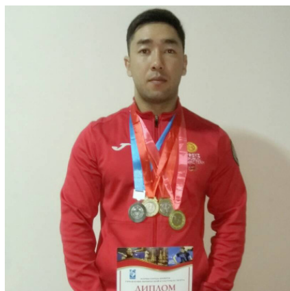
— Кабардын уландысы 4-бетте

Ден соолугу чың болуп, алты саны аман болуп туруп артынан из калтырбай кеткен адамдар бар. Ошондой эле канчалаган тоскоолдук болгонуна карабастан, жашоо менен күрөшүп, ийгиликтин артынан сая түшкөндөр бар.