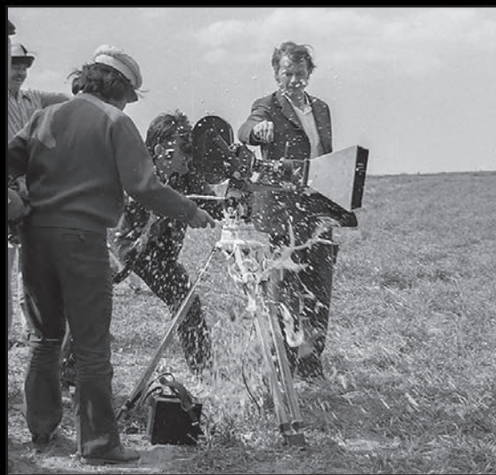
Ак Кеме (1975)