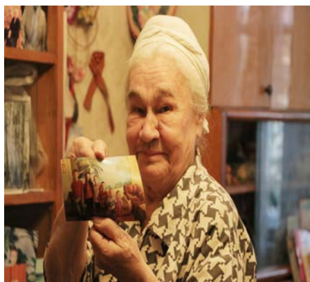
— Кабардын уландысы 7-бетте

Жашоону ар бир адам ар башка кабыл алат жана ар башка жашайт. Тактап айтканда, жашоо ар бир адам үчүн ар башка жана эч бир убакта бири-бирине окшош болбойт. Жашоо кимдир бирөө үчүн убакытка бар күчү менен тиренсе да каршы келе албаган кайгы-азап.